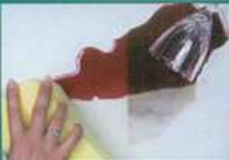
Stain-Proof on limestone.

یک درزگیر (Sealer) نافذ، غیر مرئی و دارای قابلیت جذب و دفع بخار آب می باشد که کاشی های دارای منفذ، سنگ طبیعی ، سنگ فرش و دوغاب تزریقی را از صدمات ناشی از آب ، نمکهای آبدار و لکه محافظت می کند. این محصول قادر به دفع چربی مواد غذایی و آب می باشد. این فرآورده سطح را غنی تر و قوی تر می سازد. ولی رنگ، بافت یا ظاهر آنها را تغییر نمی دهد. جذب آب را حدود ۹۸٪ کاهش می دهد، رشد خزه و میک باه را تقلیل می بخشد، و فلوتورسانس نمکی و تغییرات انجمادی را به کمترین حد می رساند. درزگیری (Sealer) با (Stain - Proof) همچنین باعث کاهش نمک یون کلراید تا حد ۹۸٪ می گردد. سطح در برابر لکه، از محافظت برخوردار می شود و در عین حال درزگیر (Sealer) از قابلیت تهویه و جذب و دفع بخار آب برخوردار می باشد. این فرآورده در برابر قلیا مقاوم است و در تماس با مواد دارای پایه سیمانی ، تجزیه نمی شود. این محصول متنوع برای آشپزخانه ، فضاهای تفریحی و استخر مناسب می باشد. آنرا می توان برای سرامیک سفالی ، کاشی ، سنگ مصنوعی ، مرمر بدون جلا ، گرانیت بدون جلا سنگ آهکی و دوغاب تزریقی مناسب است. در صورتی که آن را با یک ایلکتور (مجری) مورد تایید و رعایت دستورالعمل کتبی ما بکار ببرید و سطح با استفاده از پاک کننده محافظت شود، در آن صورت یک تضمین ۱۵ ساله داده می شود.