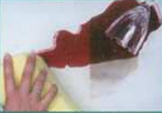
Stain-Proof on limestone.

مادة نافذة (Sealer) و غير مرئية ذات قابلية خاصة لجذب و دفع بخار الماء، تصون الرخام ذات المنافذ و الصخور الطبيعية و صخور الارضيات و البياض التزريقى، ضد الصدعات الناتجة عن الماء و الاملاح الرطبة و البقع. تستعمل هذه المادة لدفع الدسومة و المواد الغذائية و الماء و تعزز الأسطح و تقويتها، لكنها لم تغير من لونها او نسيجها. و تقلل من جذب الماء حتى 98% و تزيل الطحالب و العفن ، و تحفز من فلونورسانس الاملاح و التغيرات الناتجة عن الانجماد الى اقل حد ممكن. و ان استعمال مضادات التسرب (Stain - Proof) يقلل من ملح يون كلورايد حتى 98% ، و تتم صيانة الأسطح ضد البقع و تتمتع المضادات بقابليات التهوية و جذب و دفع بخار الماء. هذه المادة مقاومة ضد الصودا و لا تتجزأ اثر الاتصال بالمواد ذات الاساس الاسمنتى. هذه المادة المصنوعة مناسبة للمطابخ و الاجواء الترفيهية و المسابح و تستخدم للمحافظة على الكاشانى الخزفى و الكاشانى و الصخر المصبوب و الرخام غير المجلى و الغرانيت غير المجلى و صخر الجير و البياض التزريقى. عند استخدامها بواسطة اوبليكاتور مؤيد و مراعاة ارشاداتنا الخطية و استخدام المنظف (Stain - Proof) نقدم ضمان لمدة 15 عاماً.